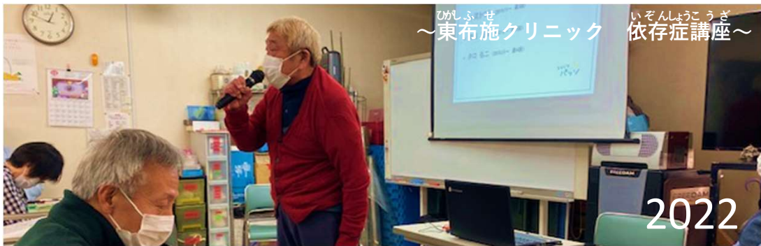
ひがしふせ いぞんしょうこうざ ～東布施クリニック 依存症講座～