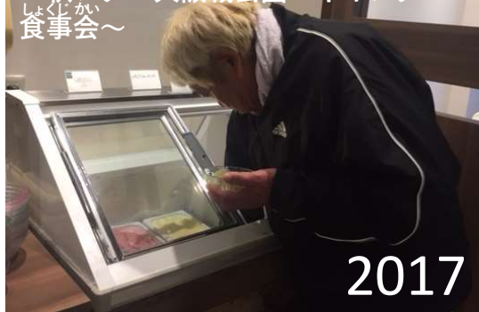
あき おおさかじょうこうえん ～秋レク 食事会～ 大阪城公園バイキング 2017