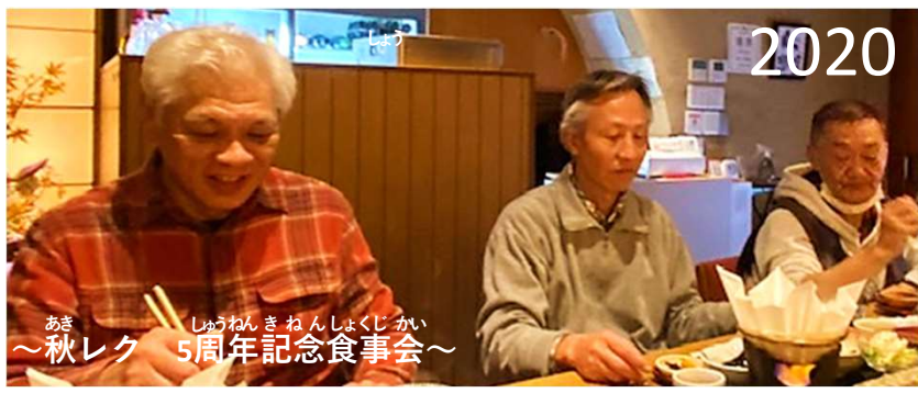
2020 あき しゅうねん きねん しよくじ かい ～秋レク 5周年記念食事会～