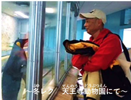
ゆ てんのうし どうぶつえん ～冬レク 天王寺動物園にて～