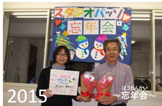
2015 ぼうねんかい ～忘年会～