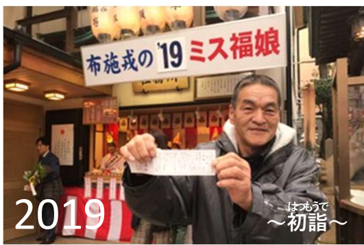
2019 はつうで ～初詣～