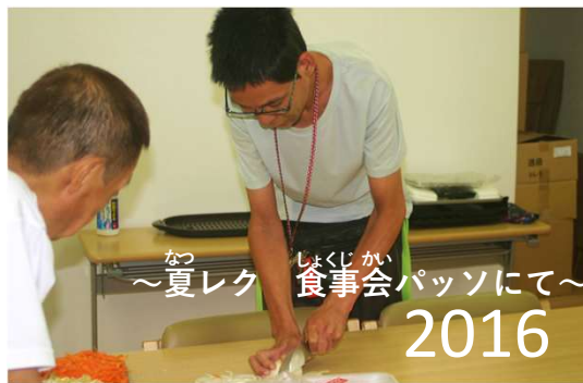
なつ しよくじ かい ～夏レク 食事会 パツソにて～ 2016