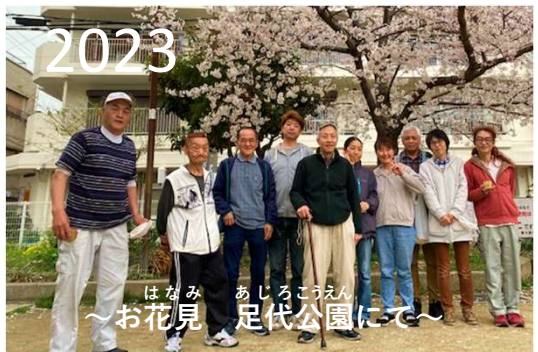
2023 はなみ あじろこうえん ～お花見 足代公園にて～