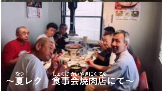
なつ しよくじ かい やきにくてん ～夏レク 食事会焼肉店にて～