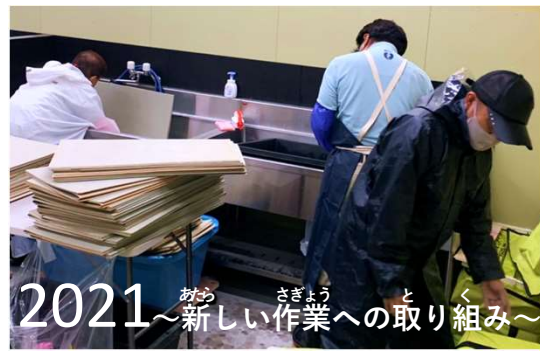
2021 おあ さぎょう とく ～新しい作業への取り組み～