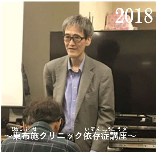
ひがしふせ いぞんしょうこうざ ～東布施クリニック依存症講座～